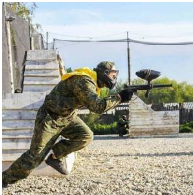
ПЕЙНТБОЛ +7 3952 43 00 38