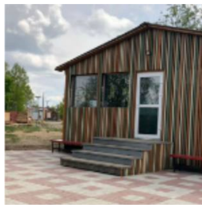
ГРИЛЬ-ДОМИКИ +7 3952 96 70 05