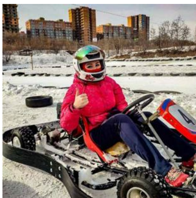
КАРТИНГ +7 902 768 19 32