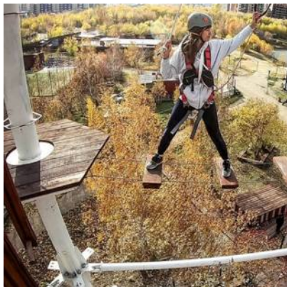
ВЕРЁВОЧНЫЙ ПАРК +7 904 142 99 55