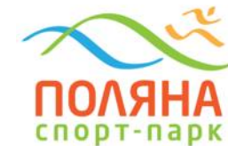
ООО «Тамат» Верёвочный парк