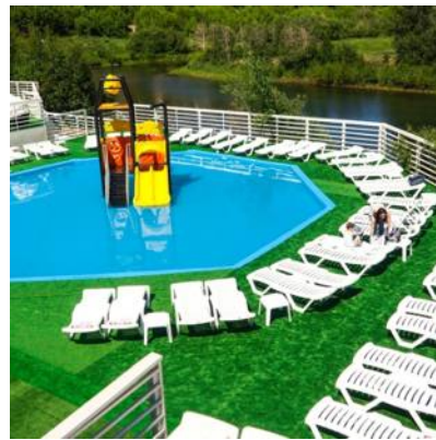
ОТКРЫТЫЙ БАССЕЙН +7 3952 96 66 00