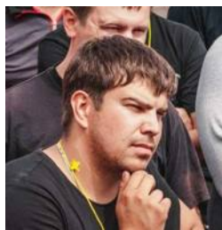
ИП Марат Дэц Вейк-станция