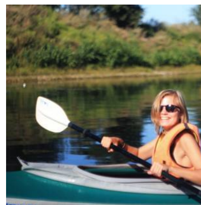
ПРОКАТ +7 902 170 58 18