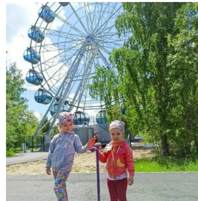
КОЛЕСО ОБЗОРА БИЛЕТЫ В КАССЕ