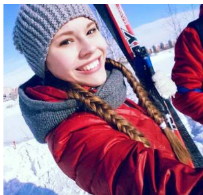
ЛЫЖНЯ +7 902 170 58 18