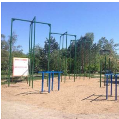
ВОРКАУТ ВХОД СВОБОДНЫЙ