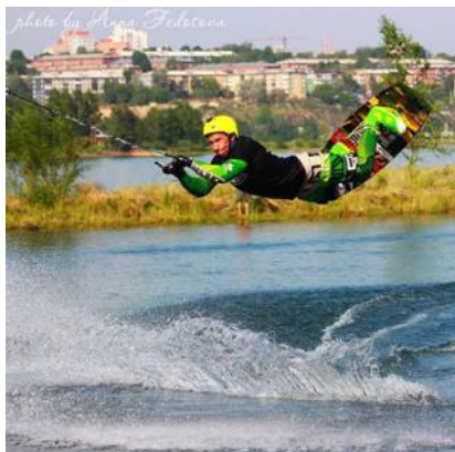
ВЕЙКБОРД +7 3952 64 91 69