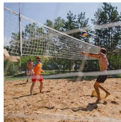
ВОЛЕЙБОЛ +7 924 611 88 33