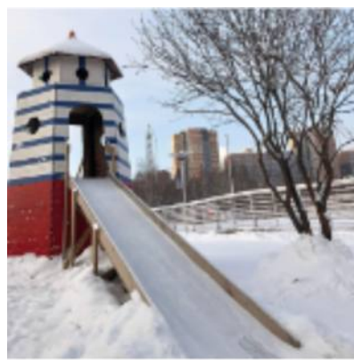
ГОРКИ +7 902 170 58 18