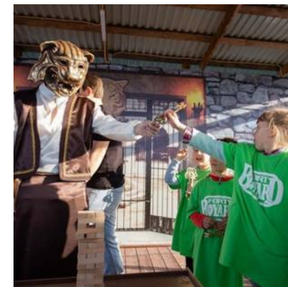
«ФОРТ БОЯРД» +7 983 466 02 41