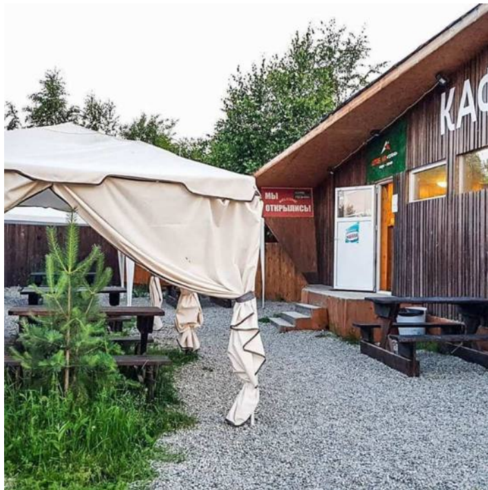
КАФЕ «ШТАБ №1» +7 3952 95 97 72