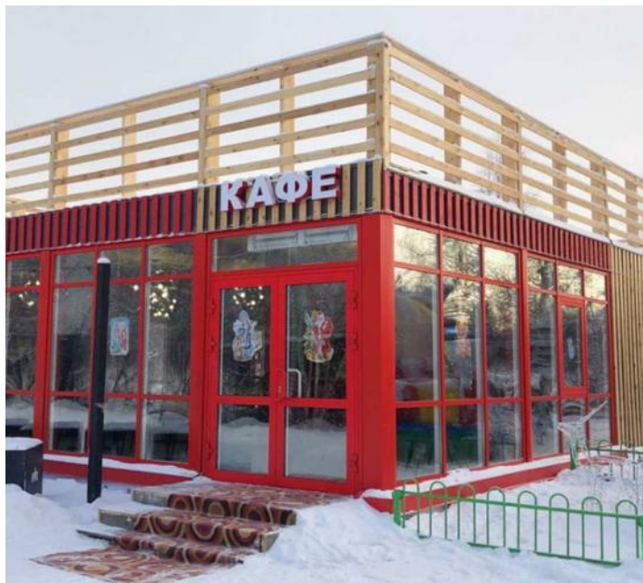
КАФЕ «ПОЛЯНА» +7 902 170 58 18