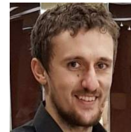
ИП Арсений Шураев Федерация пейнтбола ИО