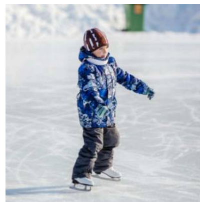
КАТОК +7 3952 44 11 44