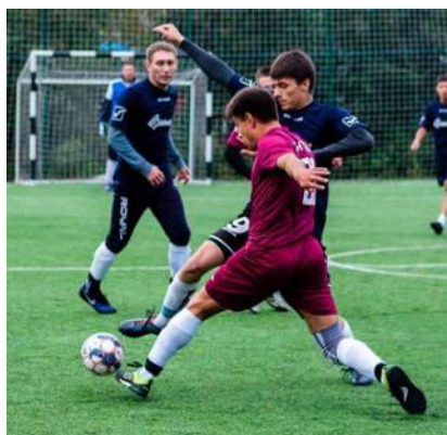
ФУТБОЛ +7 3952 65 71 21