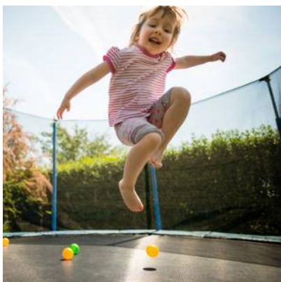
БАТУТ +7 902 170 58 18